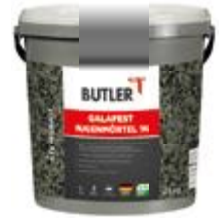
Pflasterfugenmörtel Farbe: Steingrau