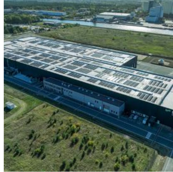
Produktionsgelände des Holzmodulwerks von timpla by Renggli