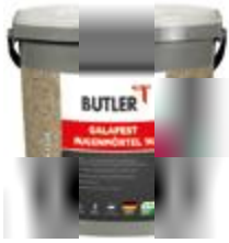
Pflasterfugenmörtel Farbe: Natur