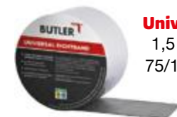
Universal Dichtband 1,5 mm, 10 m lang, 75/100/150 mm breit

Das Universal Dichtband ist ein vollflächig selbstklebendes Dichtband auf Bitumen-Basis mit einer schützenden Schicht aus polyesterverstärktem Aluminium zur wasser- und witterungsbeständigen Abdichtung von Anschlussnähten, Rissen und Lecks.