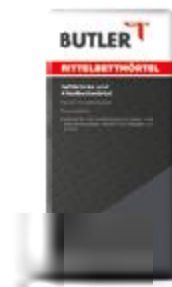
Mittelbettmörtel Gebinde: 25 kg