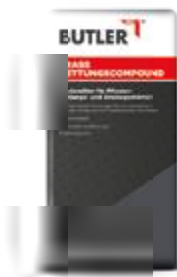
Trass Bettungscompound Gebinde: 25 kg