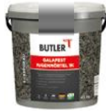
Pflasterfugenmörtel Farbe: Silbergrau