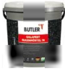
Pflasterfugenmörtel Farbe: Basalt