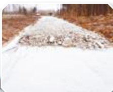
Geotextil BUTLER PRO