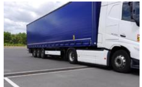
Die BIRCOsir-Rinnen entwässern nicht nur das Gelände, sondern erfüllen auch die Belastungskategorie für Schwerlastverkehre F900 nach DIN EN 1433