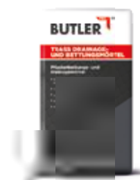
Trass Drainage- und Bettungsmörtel Gebinde: 25 kg