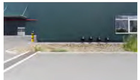
Das anfallende Wasser des 20.000 qm großen Flachdachs wird ebenfalls über die BIRCOsir-Rinnen auf dem Gelände in die Versickerungsmulden geführt

Weitere Informationen unter www.birco.de