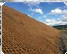
Erosionsschutz aus Jute- od. Kokosfasern