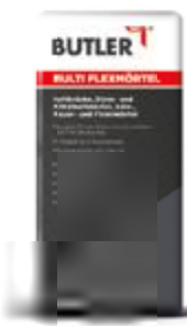
Multi Flexmörtel Gebinde: 25 kg