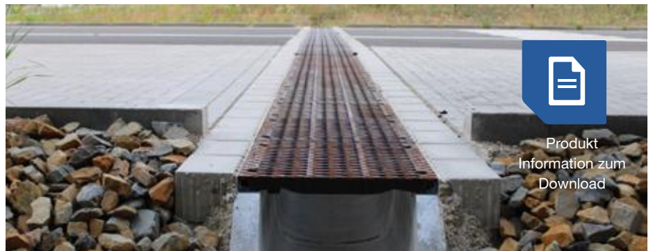
Das Rinnensystem BIRCOsir zur Entwässerung über Versickerungsmulden ist wartungsarm und für einen dauerhaften Einsatz ausgelegt

Damit bleiben auch bei Starkregenereignissen die Verkehrswege für den Lieferverkehr befahrbar. Die Rinnen sind hoch stabil (Belastungsklasse F 900 gemäß DIN EN 1433), also optimal für den Schwerlastverkehr rund um die Produktionshalle geeignet. Die Nennweiten 320 und 420 in der neuen BIRCOhyperbel-Bauform verfügen über eine DIBt-Zulassung: Planungssicherheit von Anfang an. Die Rinnen sind schnell und unkompliziert nach Typ I einbaubar (belastbar bis Klasse D 400). Mit der BIRCOsir in großen Nennweiten bietet BIRCO ein belastbares Gesamtpaket: optimierte Geometrie, einzigartige Nut- und Feder-Kontur für Dicht-/Dehnfugen und fest verankerte 4 mm Massivstahlzargen. Die Zugänglichkeit von der Oberfläche ermöglicht eine unkomplizierte Wartung.